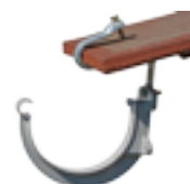
⊙ Étrier + crochet pour une pose sur couverture (tuile, tôle ou fibrociment, etc.)

Nos services techniques se tiennent à votre disposition pour fournir documents ou renseignements qui vous seraient nécessaires. Les informations dimensionnelles et dessins contenus dans l'ensemble de ce document ne sont donnés qu'à titre indicatif. Notre société se réserve la possibilité de modifier les caractéristiques de produits figurant dans le présent document. Avis important : Nous déclinons toute responsabilité en cas d'une utilisation de nos produits non conforme aux prescriptions des normes et à la destination indiquée sur nos documents commerciaux.