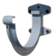
⊙ Crochet en bandeau pour une pose sur planche de rive