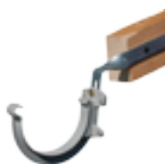
⊙ Hampe chantournée + crochet pour une pose sur le côté du chevron