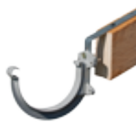
⊙ Hampe plate + crochet pour une pose sur le dessus du chevron