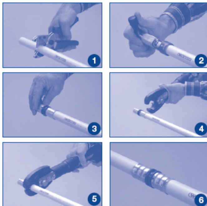
Fig. 1: Procedure montage Tigris SafePress

Garantie op de gereedschappen: zie gebruiksaanwijzing van de gereedschappen.